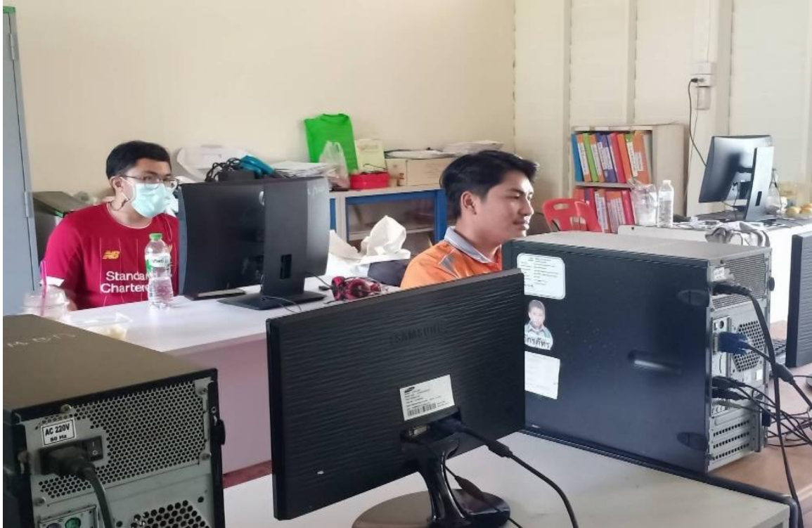
ติดตั้ง ดูแล บำรุงรักษา และพัฒนาเกี่ยวกับระบบคอมพิวเตอร์ โรงเรียนบ้านลาดโพธิ์